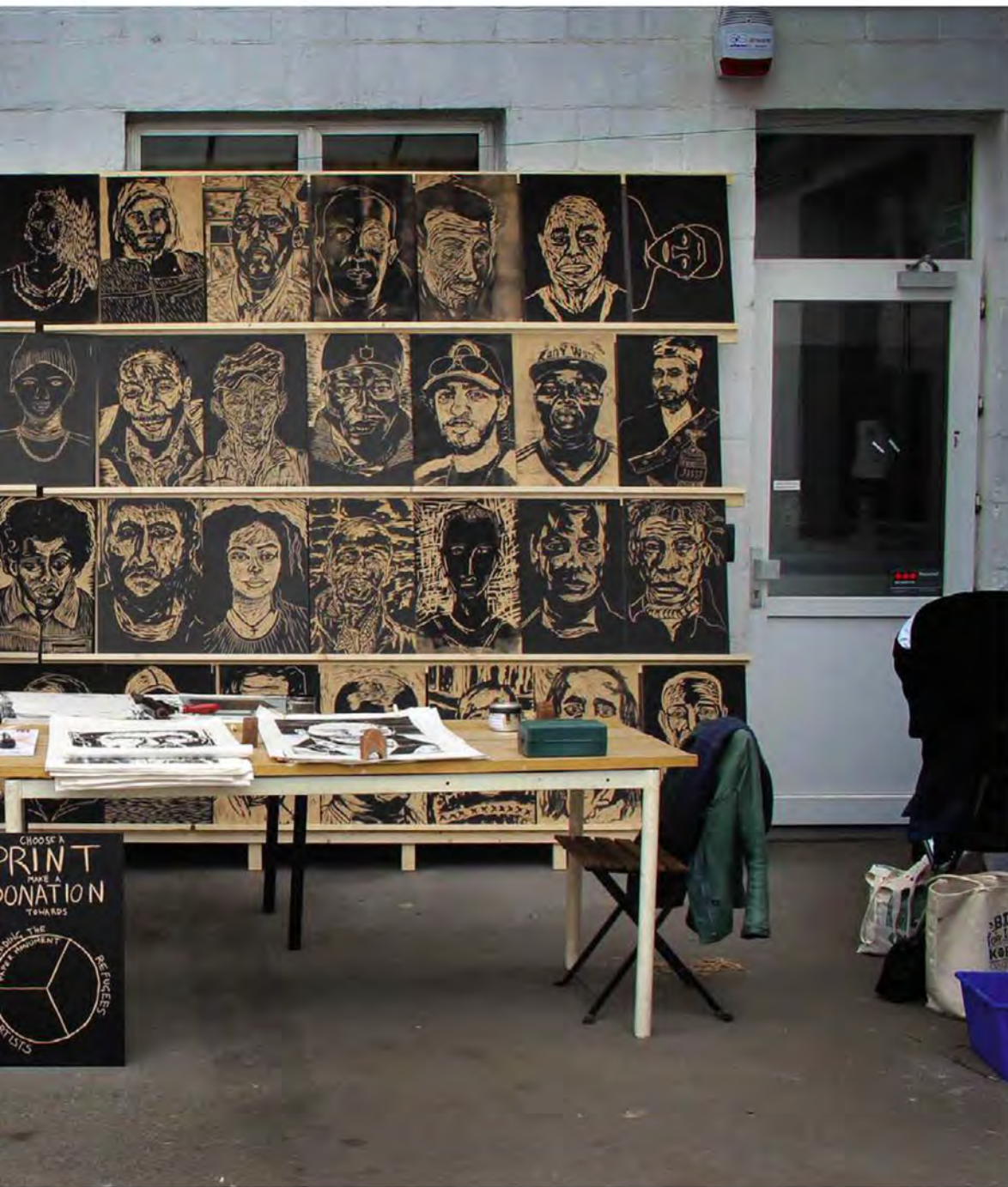
Domenique Himmelsbach: A Paper Monument for the Paperless at POPPOSITIONS

Zwart-witte linosneden van portretten met een indringende blik. In Amsterdam kom je ze overal tegen: geplakt tegen gebouwen, elektriciteitskastjes, containers en prullenbakken. Ze zijn onderdeel van het project Een papieren monument voor de papierlozen van kunstenaar Dominique Himmelsbach-de Vries. Het zijn portretten van de vluchtelingen in Amsterdam die deel uitmaken van de We Are Here groep. Zij kregen geen verblijfsvergunning en worden als uitprocedeerd aangemerkt.