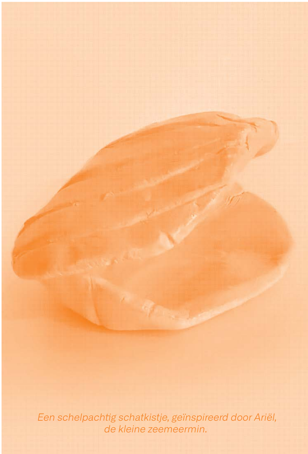
Een schelpachtig schatkistje, geïnspireerd door Ariël, de kleine zeemeermin.

ik zie mezelf in de toekomst als een gelukkig en vrij persoon die geniet van het leven