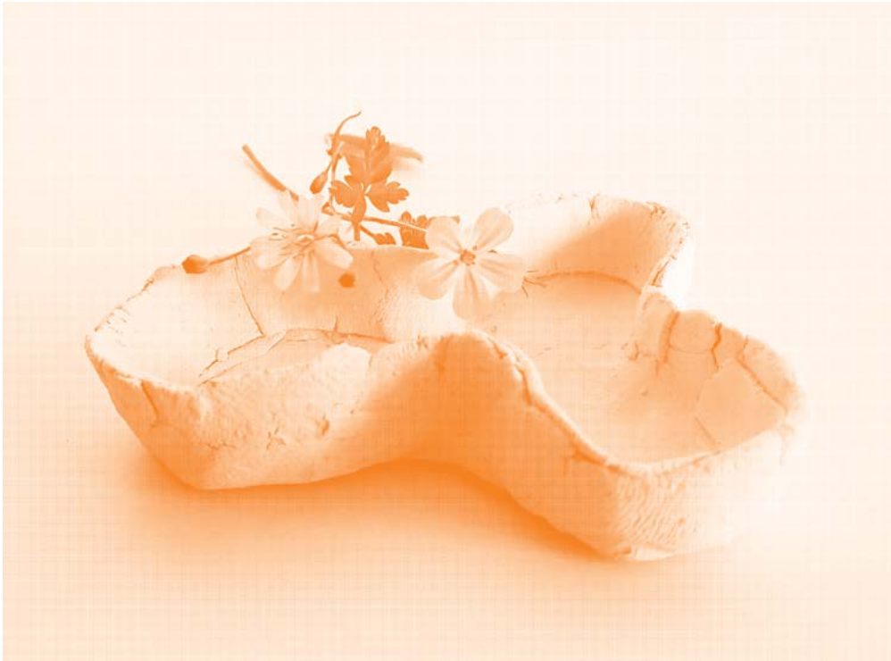
Een klein schaalje voor de ring van een verloren dierbare