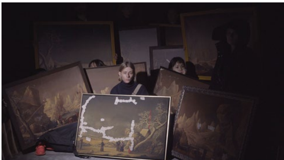
Boven: Rumiko Hagiwara - I want to be a shell (2019)