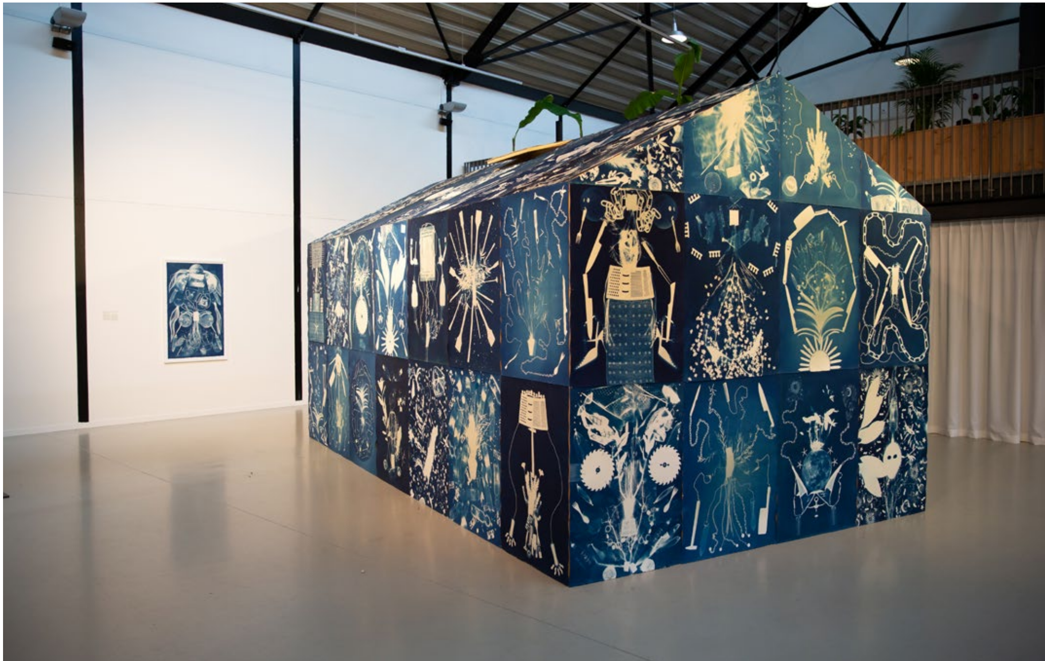
Arvo Leo – Blue House (2018)