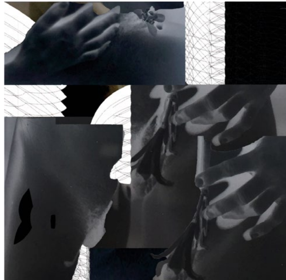
Mehraneh Atashi – They become my eyes on your body (2019)

De kunstenaar presenteert twee boeken die gaan over een betoverd bos in het voormalige Bohemer Woud, dat later werd onderverdeeld in het Duitse Nationaal Park Bayerischer Wald en het Tsjechische Nationaal Park Šumava. Het eerste boek vertelt en analyseert een ontdekking van een aantal wetenschappers die tussen 2002 en 2011 een groep edelherten in het bos volgden. Het bleek dat vrouwelijke edelherten uit beide landen de lijn waar ooit het IJzeren Gordijn stond, niet over gingen, terwijl de hekken in 1989 al werden weggehaald. Het tweede boek vertelt het verhaal van een geheime